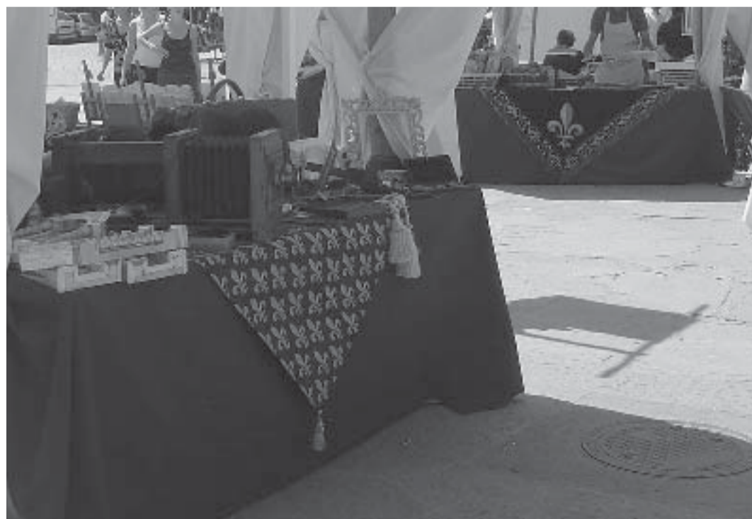
prima immagine: logo del Chichibio realizzato da Antonella Ulivelli seconda immagine: il Chichibio di giugno 2007 in Piazza Santa Croce

Per maggiori informazioni: antonella.ulivelli@yahoo.it